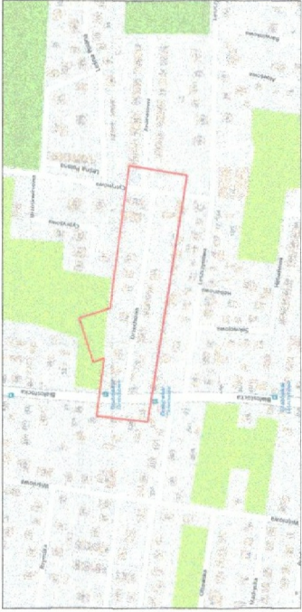
Położenie obszaru opracowania